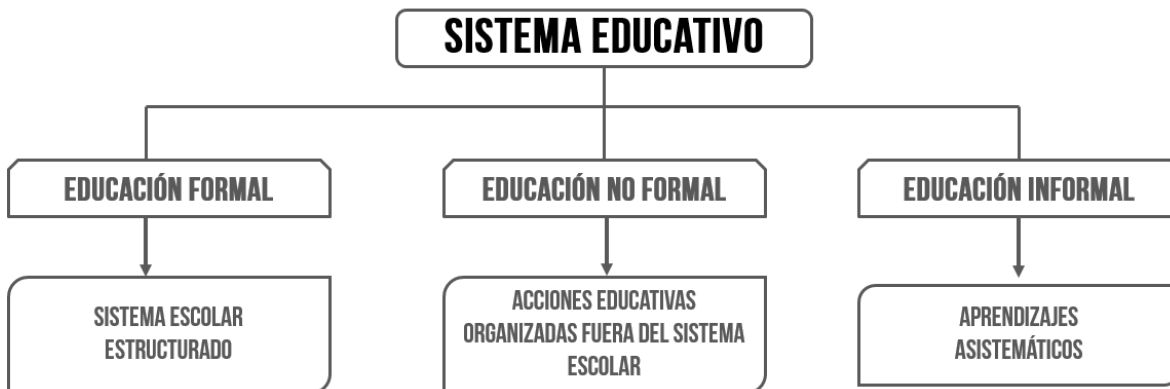
Ilustración 1: Campos del sistema educativo

También para inicios de los años setenta se formaron grupos institucionalizados para el estudio de la educación no formal, así mismo, el concepto de educación no formal fue aceptado por la UNESCO. Desde ese entonces instituciones y prestigiosos investigadores alrededor del mundo se han volcado en el estudio y reflexión de los principios y fenómenos que enmarcan esta propuesta educativa.